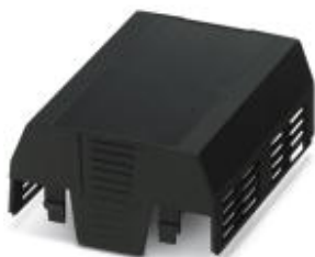
Einbaugeschützgehäuse, ohne Anschlussöffnung, Oberteil, Farbe: schwarz, Breite: 90 mm

Bitte beachten Sie, dass die hier angegebenen Daten dem Online-Katalog entnommen sind. Die vollständigen Informationen und Daten entnehmen Sie bitte der Anwenderdokumentation. Es gelten die Allgemeinen Nutzungsbedingungen für Internet-Downloads. ( http://phoenixcontact.de/download )