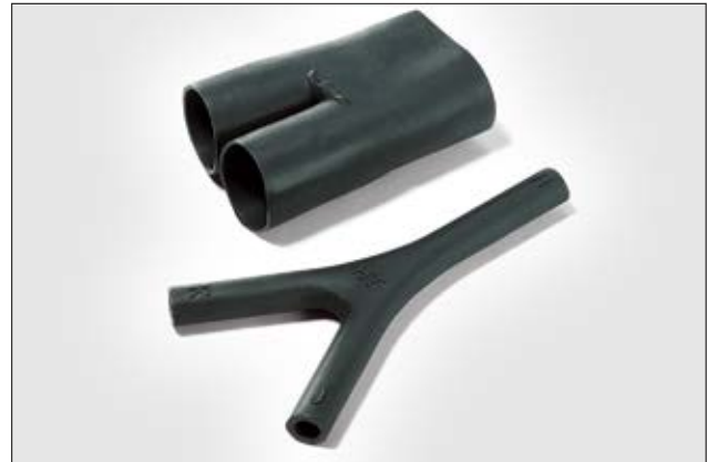
Helashrink Serie 492H412-415 geschrumpft und ungeschrumpft.

Auf Seite 260, 261 befinden sich Material- und Kleberinformationen.