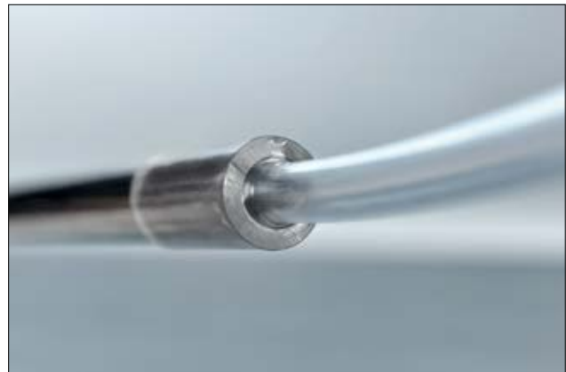
Tubo transparente TF24 con grado de contracción 2:1.