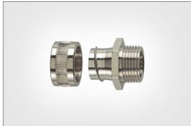
HelaGuard SC-FM mit starrem Außengewinde.

Weitere Verschraubungen mit PG- und drehenden Gewinde auch verfügbar. Für mehr flexible Kabelschutzschläuche und Verschraubungen, siehe den HelaGuard-Katalog.